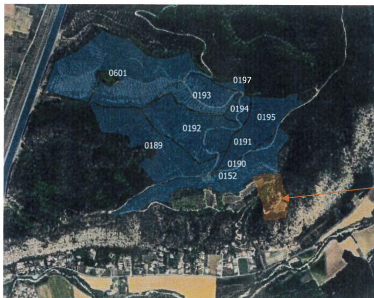
Vue satellite annotée montrant les parcelles d'implantation du projet de parc photovoltaïque

Proposition : supprimer DEFINITIVEMENT la parcelle C152 du projet de parc photovoltaïque du bois de Saint Martin.