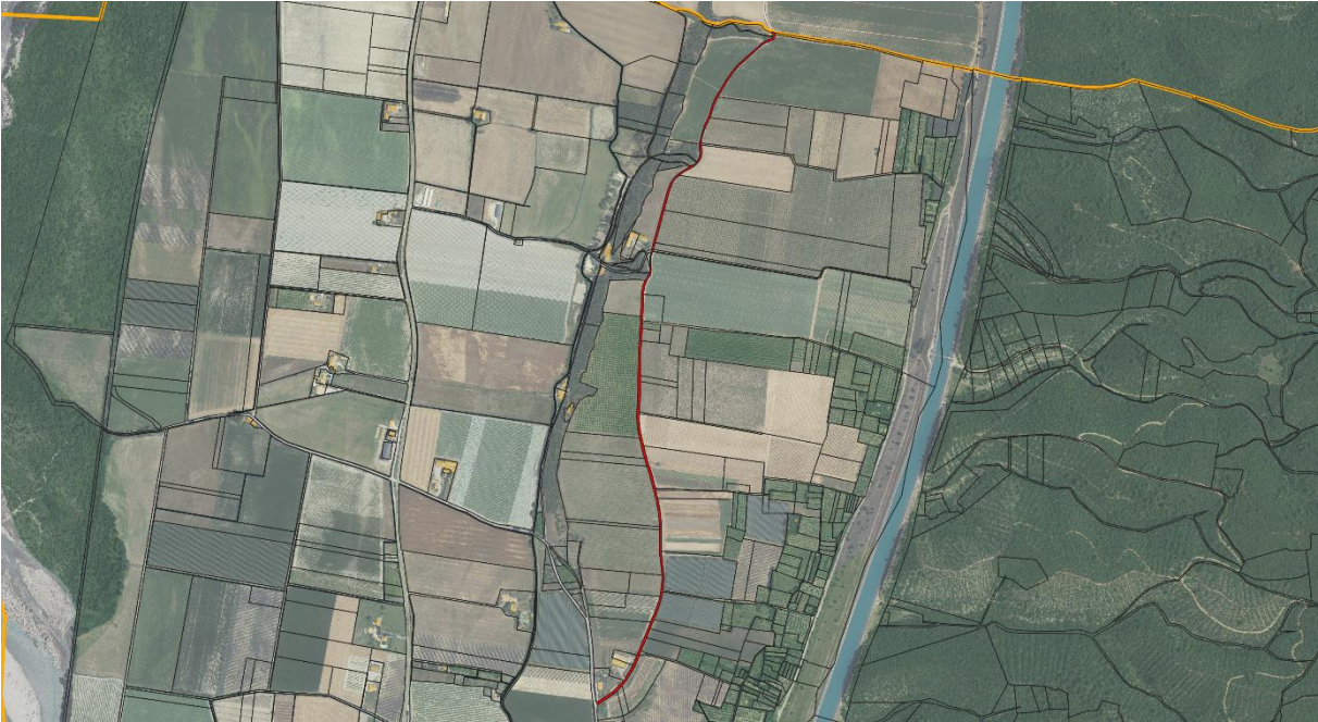
Annexe 2 : localisation de la voie à dénommer (point n° 1)